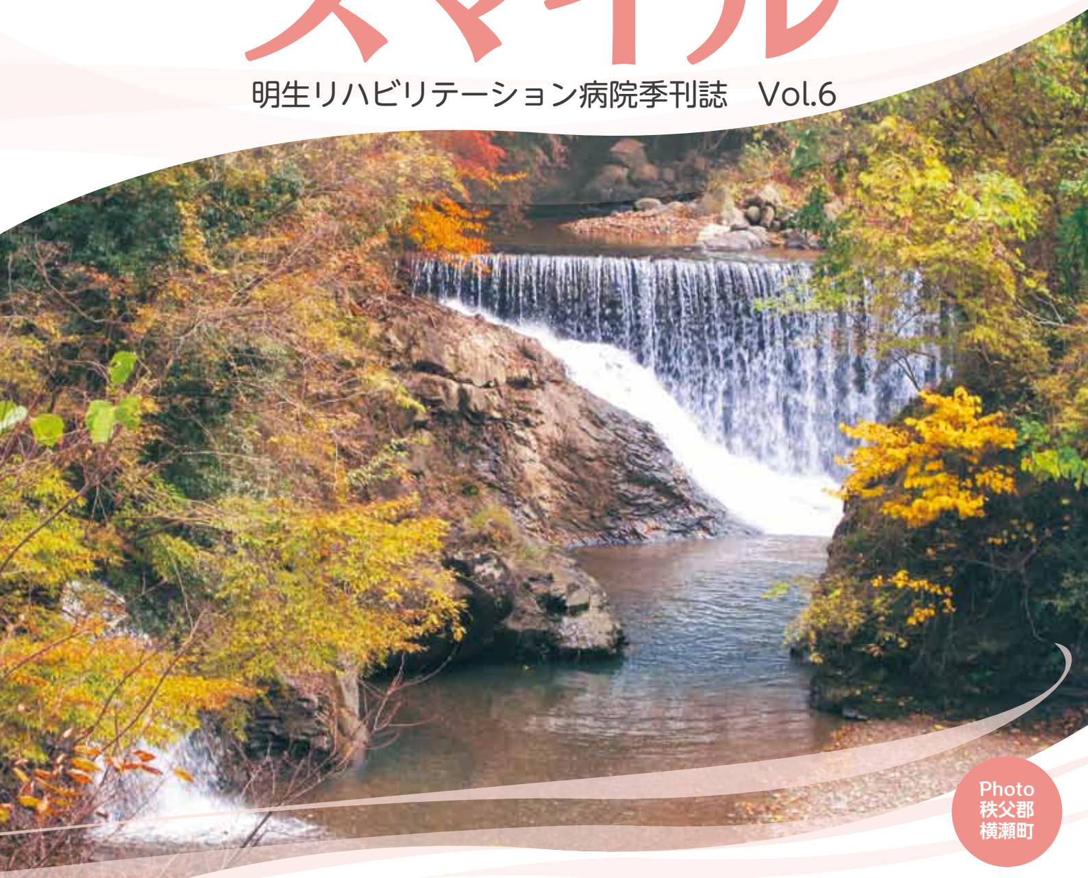
Photo 秩父郡 横瀬町